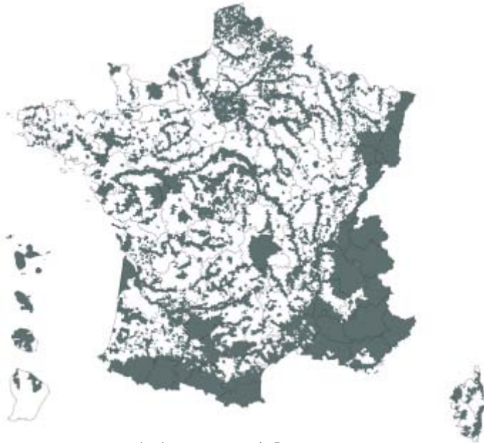
carte des communes de France où s'applique l'obligation d'établir un état des risques